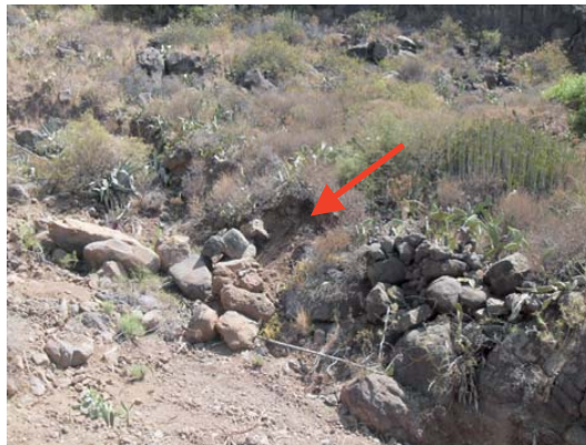
Fotos 2,3 y 4. Fotos donde se representa el desmonte de la rasante del cauce.