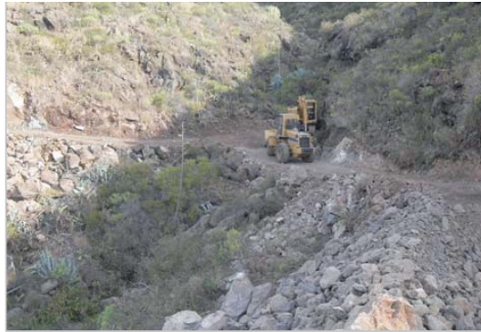
Foto 1. Foto donde se representa la formación de un acceso y plataforma mediante terraplén en el lecho del cauce que altera su perfil longitudinal.